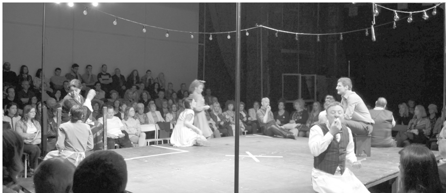
"РУЖА УВЕЛА", НАЈБОЉА ПРЕДСТАВА НА ФЕСТИВАЛУ