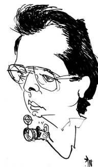
Пише : Драган Јанковић Рота

Ј оаким је мушко хришћанско, односно библијско име, које потиче из старохебрејске речи „иећо-иаџим“, што значи „Бог је поставио“. У Библији, ово је име оца Девице Марије. Од овог имена изведена су имена Аћим и Јаћим. Име познато и користи се по целој Европи. Баскијски: Jokin, бугарски Јоаким, каталонски: Joaquim, Quim дански, фински, норвешки, шведски: Joakim, холандски: Jochem, Jochen, Joachim, француски Joachim, немачки: Joachim, Jochen, Achim, грчки Ιωακείμ, мађарски Joachim, италијански Gioacchino, португалски Joaquim, руски Хоакин, шпански Joaquín.