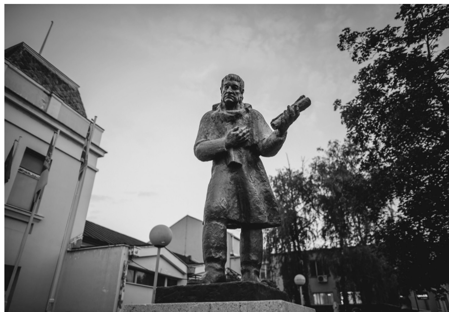
ФОТО: Ненад Борисављевић